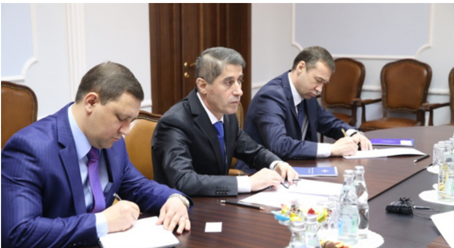
جماخون گیوسوف (نفر میانی)

{ کمیته اجرایی } ساختار ضد تروریسم منطقه‌ای (RATS) که مقرر آن در تاشکند ازبکستان است، یک ارگان دائمی در سازمان همکاری شانگهای است که به منظور ارتقای همکاری کشورهای عضو در برابر شرارت تروریسم، تجزیه طلبی و افراط‌گرایی عمل می‌کند. مدیر کمیته اجرایی RATS برای یک دوره سه‌ساله انتخاب می‌شود. مدیر فعلی «جماخون گیوسوف» تاجیکستانی است که در یکم ژانویه ۲۰۱۹ این سمت را بر عهده گرفت. هر کشور عضو نماینده دائمی خود را به RATS می‌فرستد.